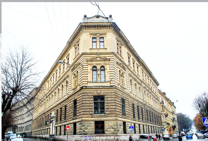
Львівський державний університет фізичної культури імені Івана Боберського