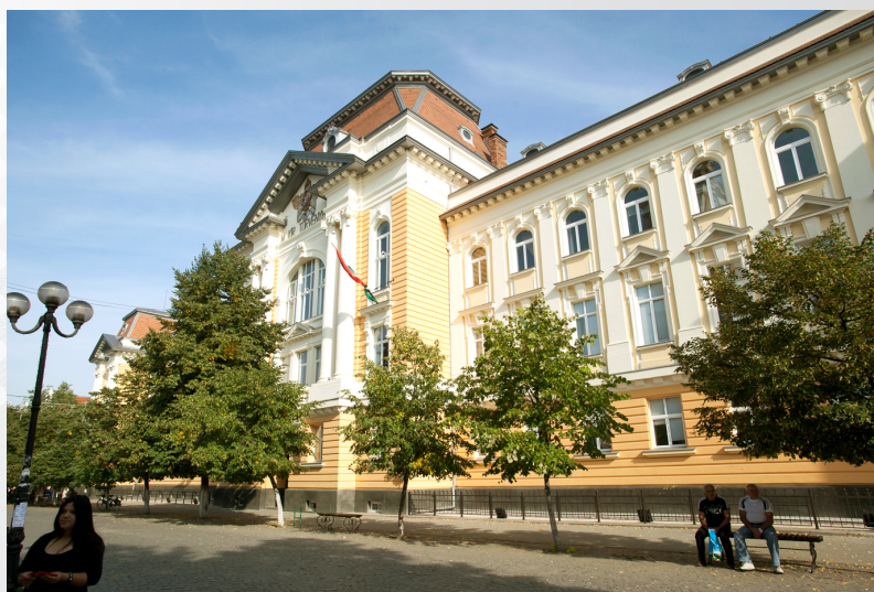
Закарпатський угорський університет імені Ференца Ракоці II